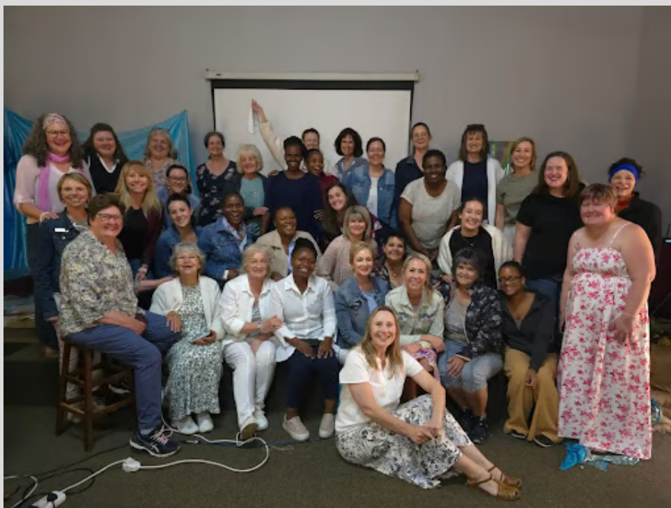
Die vroue by "Take Heart! God is Faithful" kamp.

1 Korintiërs 3:6-7: "Ek het geplant, Apollos het natgemaak, maar dit is God wat laat groei het. Dit gaan dus nie om die een wat plant of die een wat natgooi nie, maar om God wat laat groei."